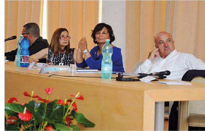
La presentazione di "Insula" al museo archeologico