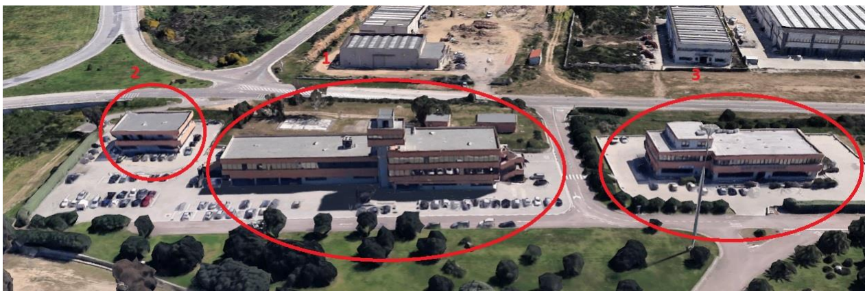
Edificio 1, 2 e 3