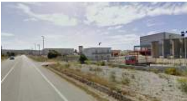
S.P. 82 - Direzione ovest