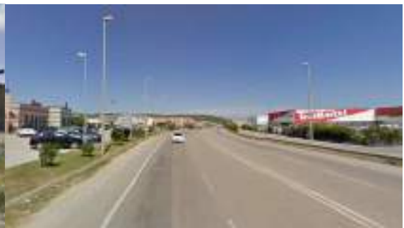
Via Corea - Direzione est