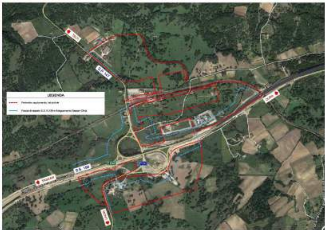
Immagine zenitale del Polo di Sviluppo di Monti

di Monti, è posta a circa 2,5 chilometri dalla periferia nord del centro urbano di Monti, nella zona Monti Scalo e comprende tre settori separati tra loro da diverse viabilità S.S. Provinciale 199, la S.S. Sassari-Olbia e la linea ferroviaria, ad una distanza di circa 20 Km dall'agglomerato industriale di Olbia. Il territorio a cui il nuovo agglomerato industriale fa riferimento è quello di Monti, ma ad esso possono riferirsi anche ambiti urbani ulteriori, soprattutto in relazione al nuovo scenario territoriale che si configura con l'ampliamento del nuovo asse della S.S. Sassari-Olbia con rafforzamento della sua capacità di attrazione insediativa legata ad un forte livello di accessibilità territoriale e, in particolare, direttamente collegata al polo industriale di Olbia, al porto e all'aeroporto che consentirà tempi di raccordo fra le due aree industriali nell'ordine dei 10 – 15 minuti.