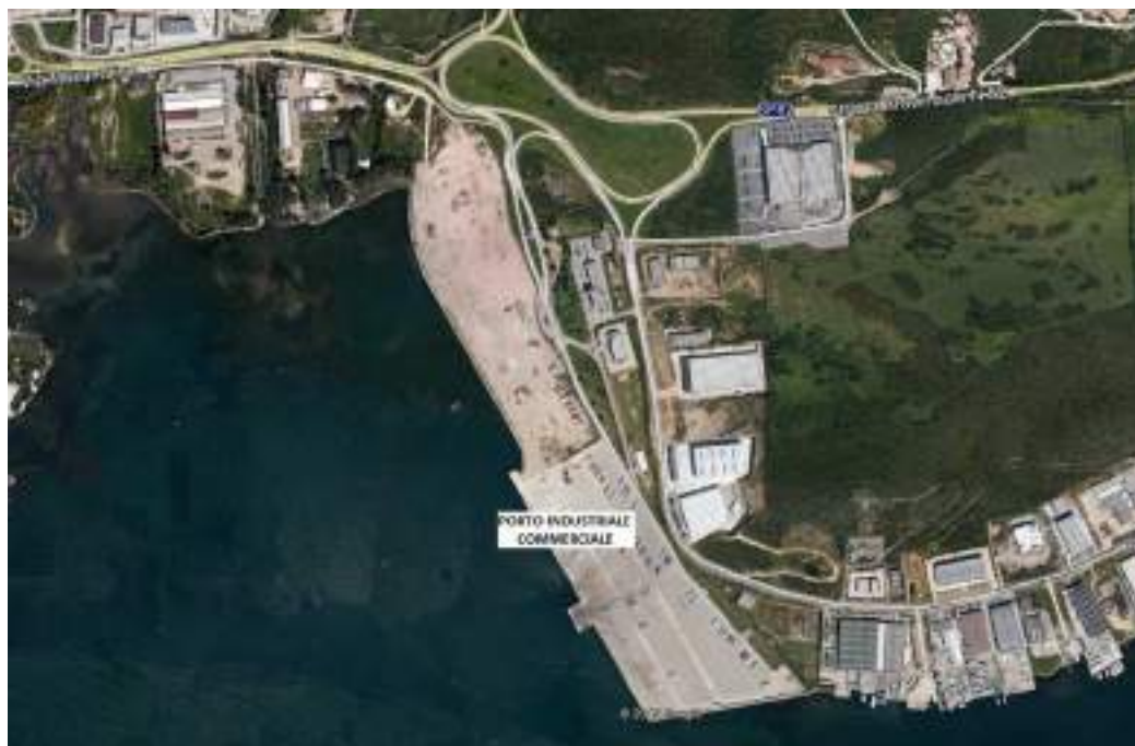
Vista zenitale Porto Industriale – Commerciale Loc. Cala Saccaia