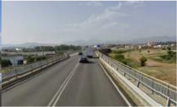
S.S. 125 - Direzione sud