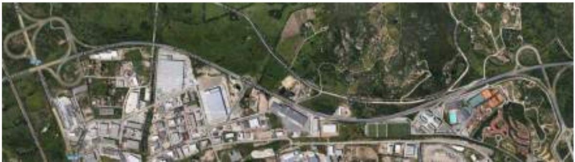
Immagine zenitale del tracciato della circonvallazione ovest e dello svincolo con la S.S. 125