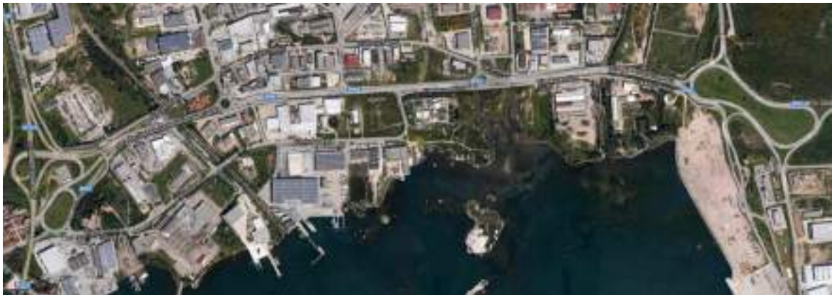
Immagine zenitale del tracciato della S.P. 82 e dello svincolo con la S.S. 125