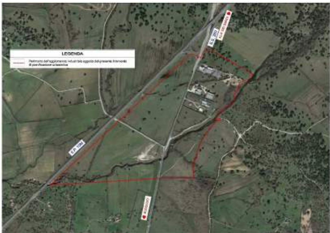
Immagine zenitale del Polo di Sviluppo di Buddusò – Alà dei Sardi

La realizzazione della nuova area industriale prefigura infine, in modo compiuto, il sistema funzionale delle opportunità insediative di competenza del CPSIO, costituito da agglomerati diversi, con forte livello di relazione trasportistica e accessibilità reciproche, capaci di fornire un’offerta articolata e differenziata di opportunità di insediamento a imprese dei diversi settori, con realizzazione di agglomerati “specializzati”, in relazione a particolari tipologie d’impresa e filiere produttive.