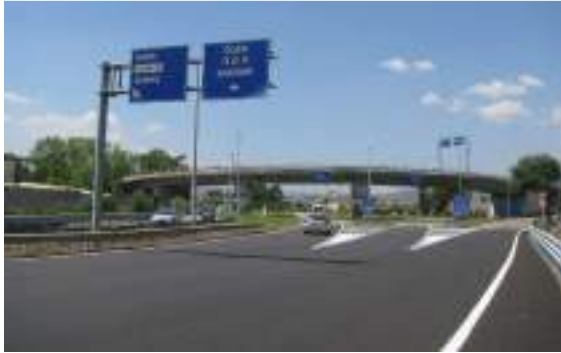
S.P. 82 - Vista da est