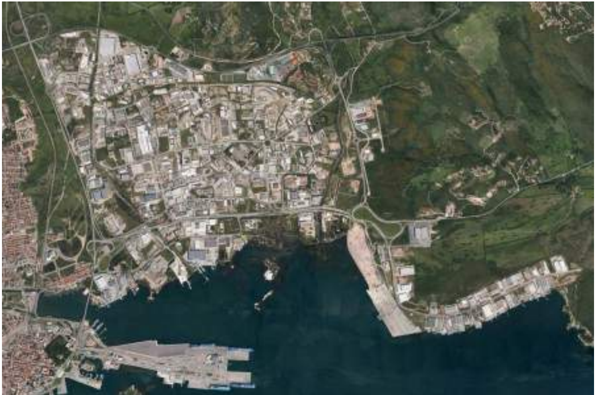
Immagine zenitale dell'agglomerato industriale di Olbia