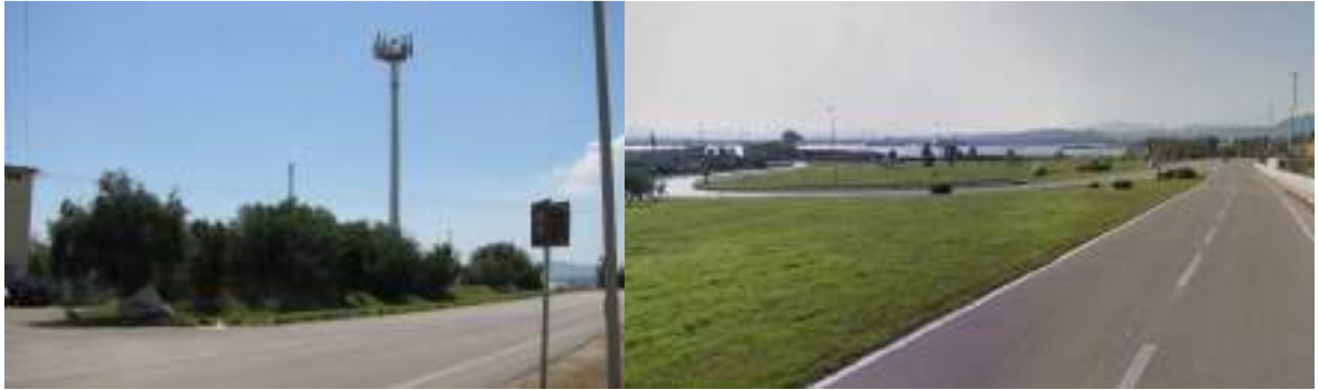
Sistemazioni a verde lungo la viabilità consortile