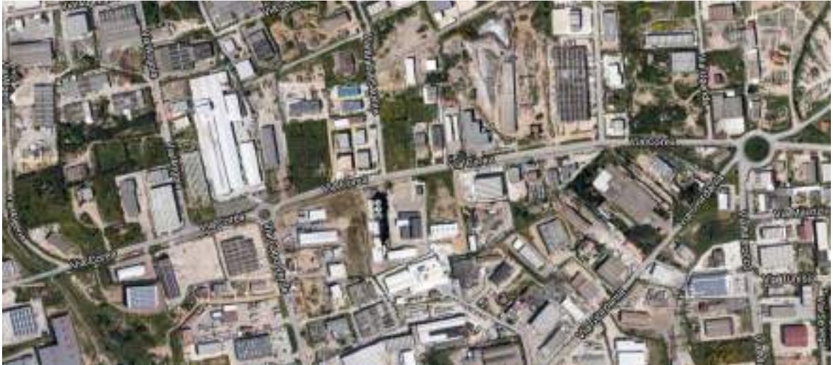
Immagine zenitale del tracciato di Via Corea, asse viario centrale dell'agglomerato industriale di Olbia